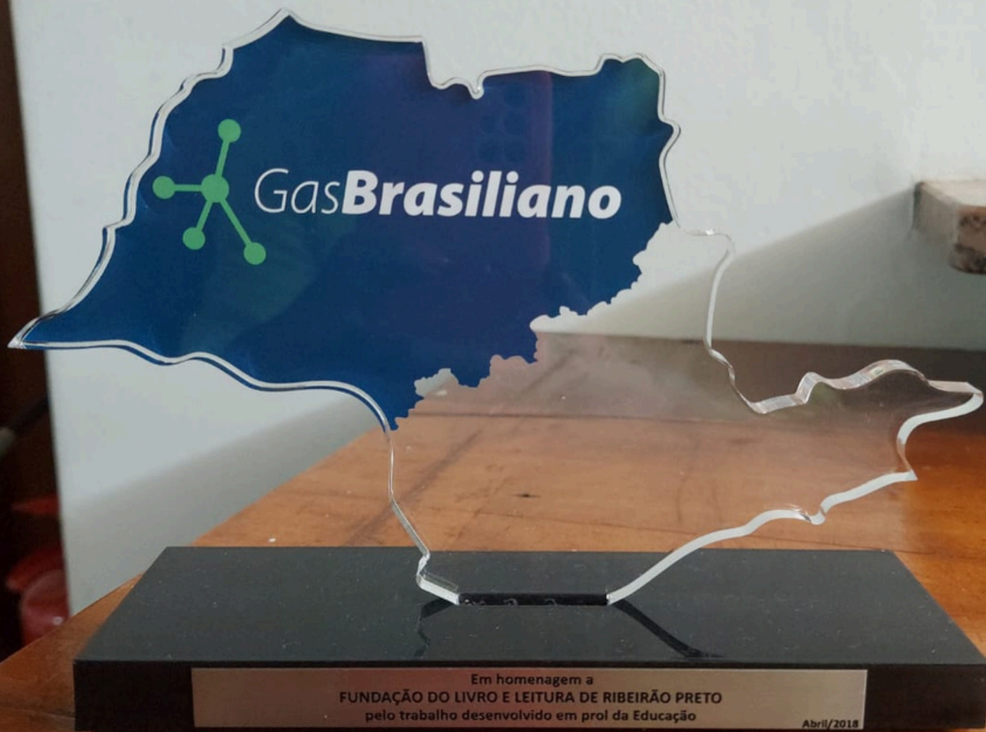
Prêmio GasBrasiliانو de Educação (2018)